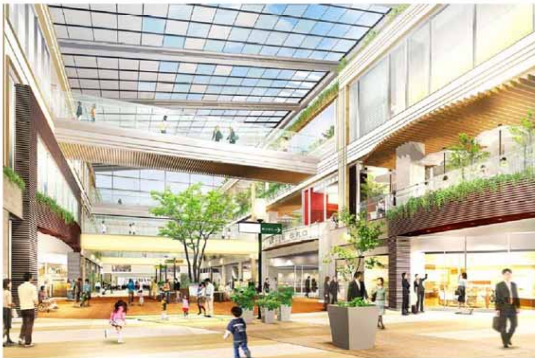
自由通路パースイメージ