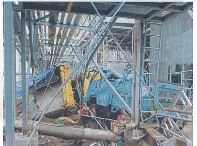
【車両が散乱する構内】