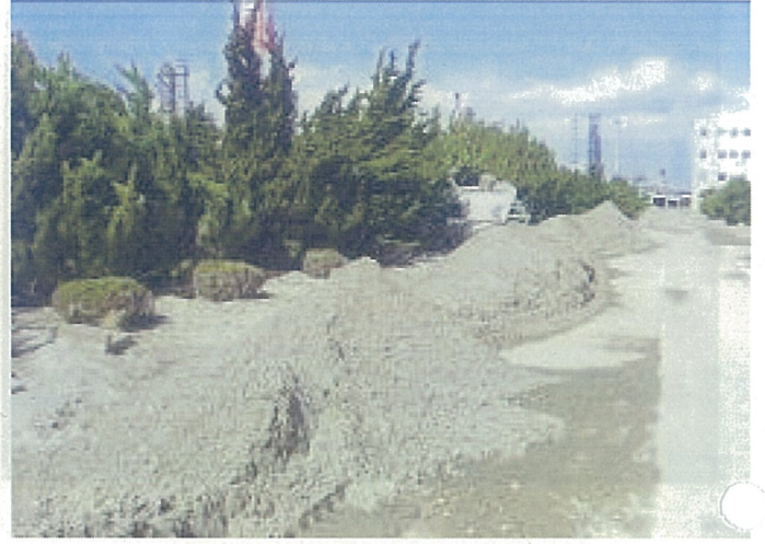
【集積した堆砂(構内西側)】