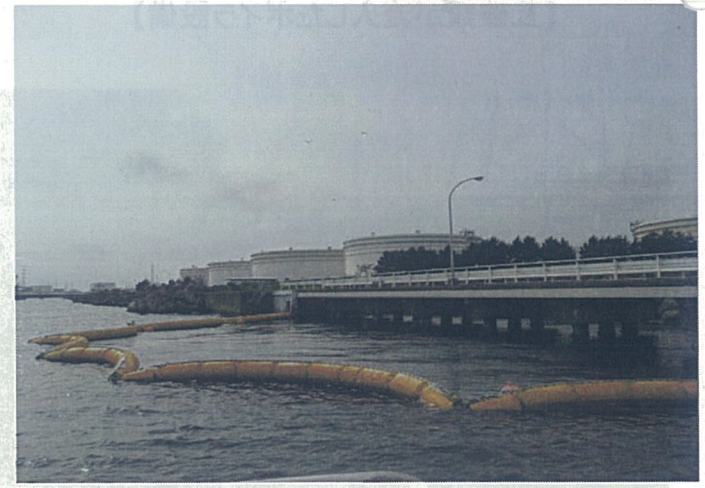
【震災前の深層取水設備】