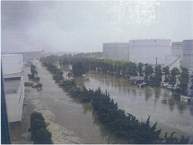
【津波発生直後(構内西側)】