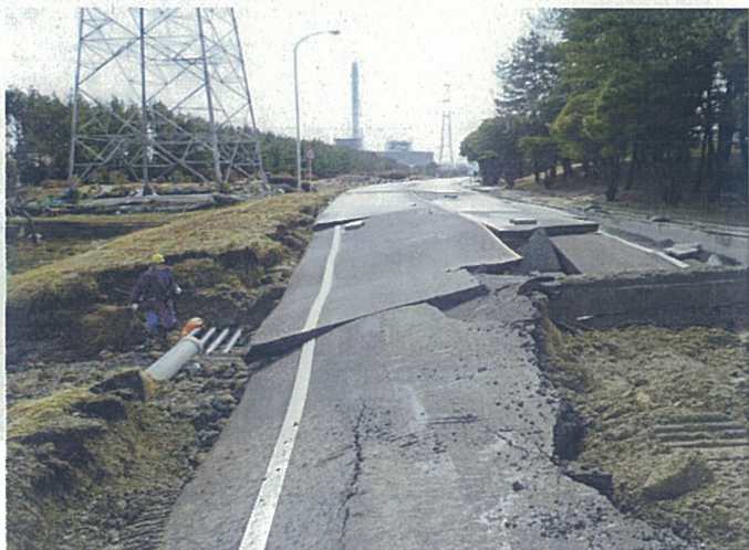
【発電所進入路損壊(JX前)】