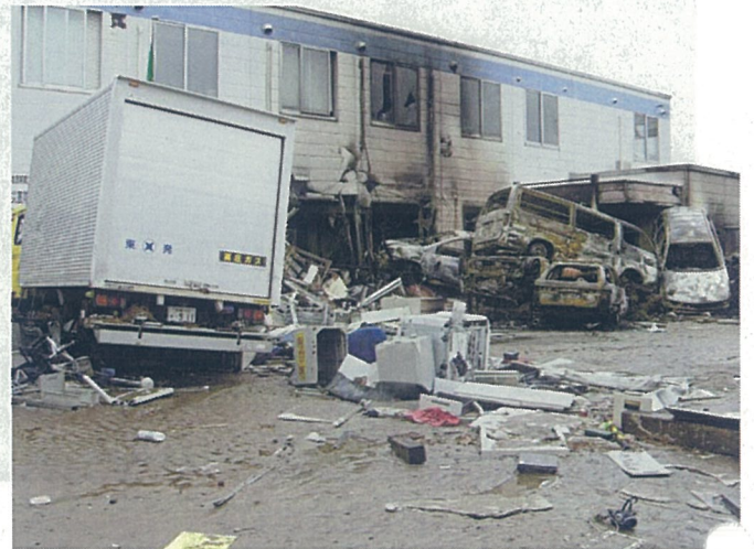
【車両が流入し損壊した構内関係会社事務所】