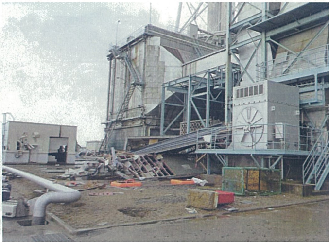
【瓦礫類が流入したボイラ設備】