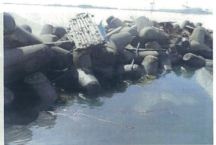
【重油等が付着した取水口消波ブロック】