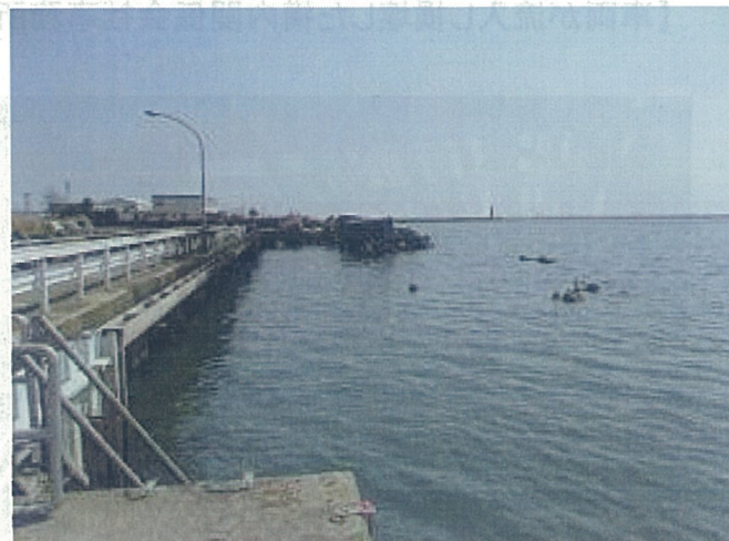
【破損した深層取水設備】