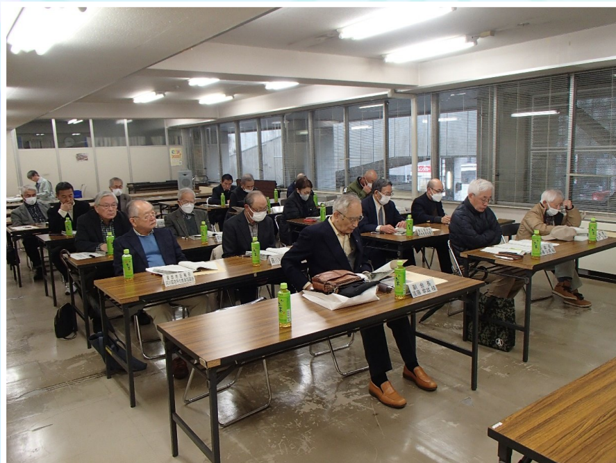
仙台市河川愛護会幹事会の様子

令和6年3月26日(火) 14時開始 市役所本庁舎2階会議室 仙台市河川愛護会幹事会開催 令和6年度河川愛護活動に向けた運動方針を討議