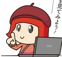
マスコットキャラクター さっち