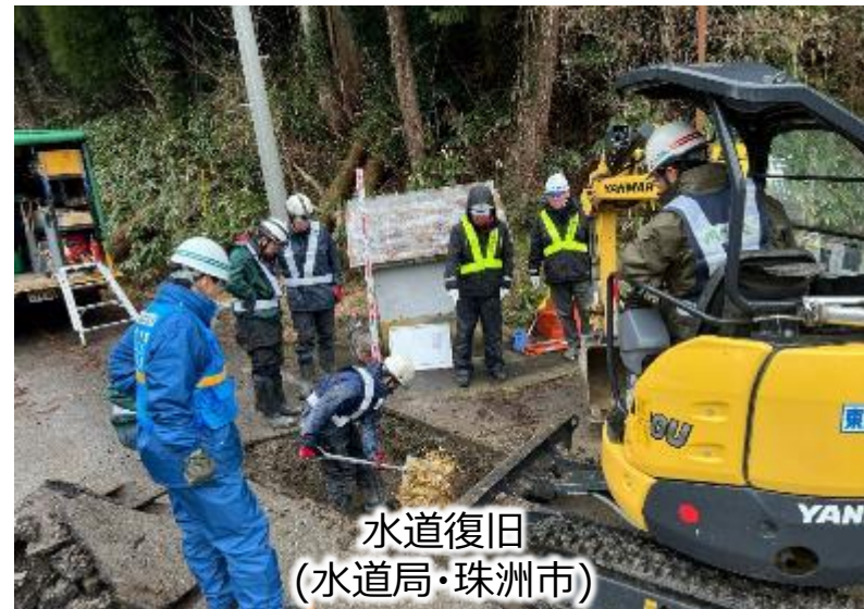
水道復旧 (水道局・珠洲市)