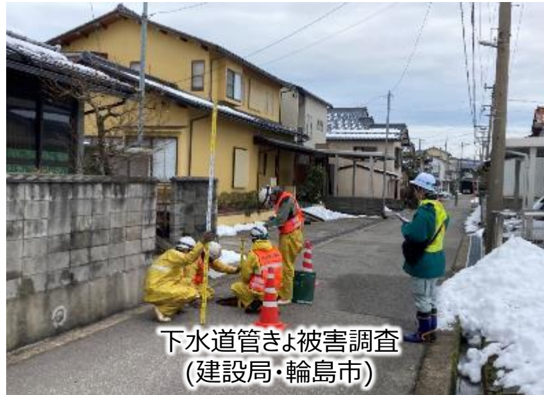
下水道管きよ被害調査 (建設局・輪島市)