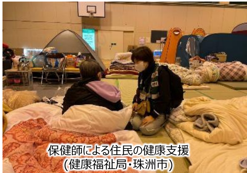
保健師による住民の健康支援 (健康福祉局・珠洲市)