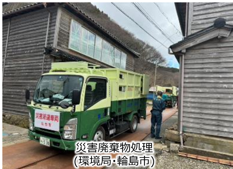
災害廃棄物処理 (環境局・輪島市)