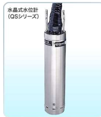
水位計センサー:保護管に挿入して河底に設置