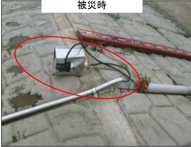
プルボックス破損,ケーブル切断