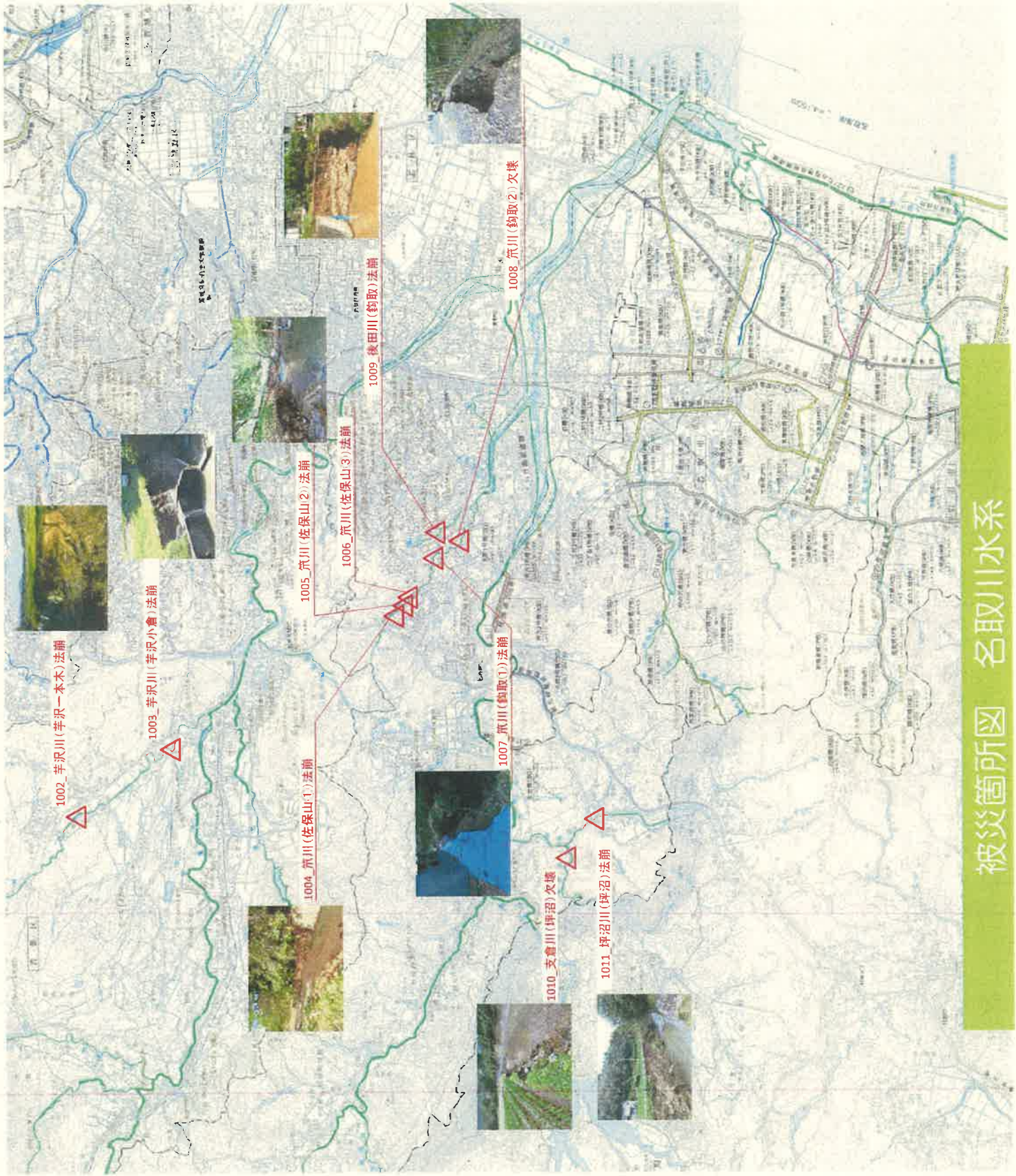
1002_芋沢川(芋沢一本木)法崩