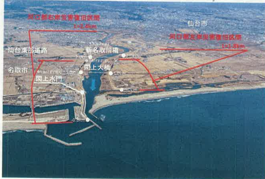
復旧状況斜め写真(平成29年2月25日撮影)