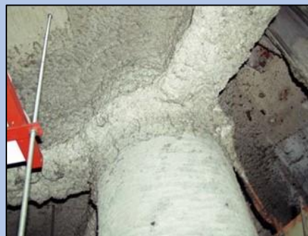
吹付けアスベスト