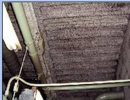
アスベスト含有吹付ロックウール