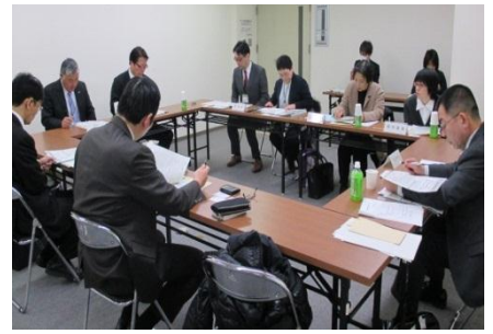
グループインタビューの様子

インタビューでは、職員に対する研修やハード面のバリアフリーに関する取り組みなど、各事業者で様々な取り組みが行われていることがわかりました。一方で、障害のある人と接する機会が少ないことから来る不安や、周囲の理解が足りないことによる苦情・トラブルについての話もあり、社会全体の理解や適切な相談支援体制が必要といった意見が出されました。