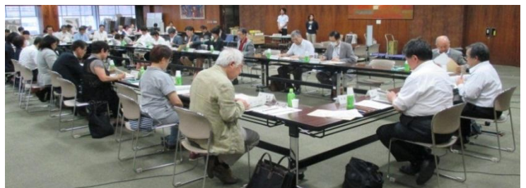
第3回障害者施策推進協議会の様子