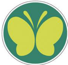
【聴覚障害者標識 (聴覚障害者マーク)】 所管：警察庁