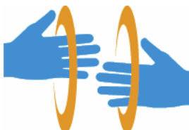
【手話マーク】 所管：一般財団法人全日本ろうあ連盟