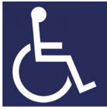
【障害者のための国際シンボルマーク】 所管：公益財団法人日本障害者リハビリテーション協会