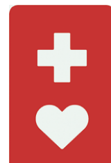
【ヘルプマーク】 所管：東京都