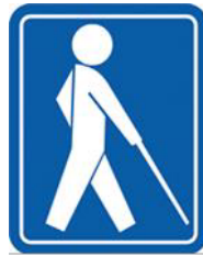
【盲人のための国際シンボルマーク】 所管：社会福祉法人日本盲人福祉委員会