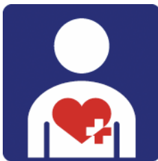
【ハート・プラスマーク】 所管：特定非営利活動法人ハート・プラスの会