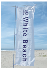
▲目印のホワイトビーチのぼり旗