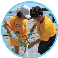
▲「ペガルタ仙台」オリジナルTシャツ