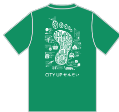
▲「CITY UP せんだい」オリジナルTシャツ