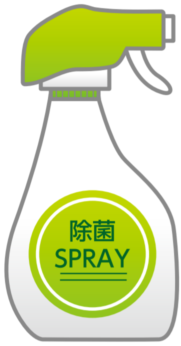
除菌・消臭 スプレー