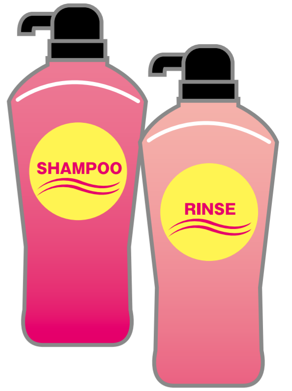
シャンプー・リンス