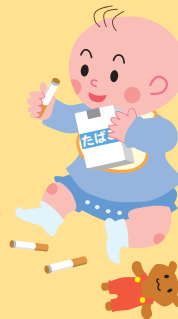
喫煙と乳幼児突然死症候群との関係