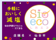
塩ecoプライスレール用POP

減塩商品のスイングPOPやプライスレール用POPがあります。店舗に合わせてご使用ください。