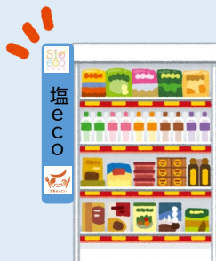
減塩商品コーナーの設置