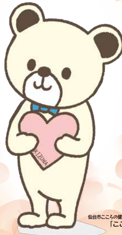
仙台市こころの健康づくりキャラクター「ここまる」