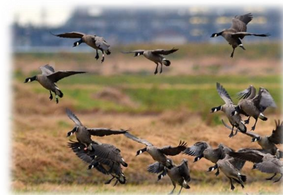
国内に飛来したシジュウカラガン