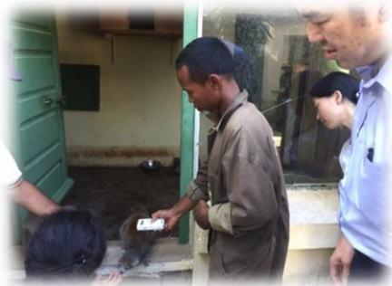
マイクロチップリーダーを使った個体識別の指導