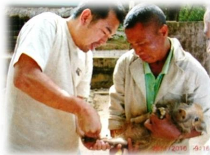
獣医と飼育員に駆虫薬投与法の指導