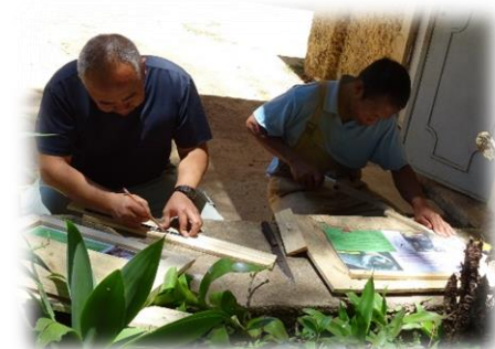
動物展示看板作成の指導