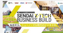
ビジネス開発プログラム「SEDAI X-TECH BUSINESS BUILD」

介護現場のニーズ調査、製品・サービスの開発・実証支援及び介護現場へのICT導入・定着により介護現場の労働負担軽減・生産性向上や、ICT企業の介護分野への事業展開を支援します。