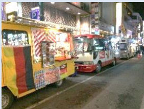
キッチンカーマルシェ実証実験イメージ

「仙台テレワークサポートデスク」を通じて、テレワーク導入を支援することにより、中小企業の「新しい生活様式」を踏まえた新たなビジネススタイルを支援します。ICT活用による地域企業のデジタル化を推進し、新たな市場の開拓や生産性向上などによる経営力強化に向けて、専門家による伴走支援やセミナー、地元ICT関連企業とのマッチング等を行います。