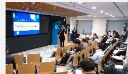
第6回ヘルステックMeetupの様子