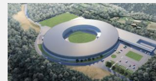
次世代放射光施設完成予想図

既存放射光施設におけるトライアルユースの実施により、その利活用事例の広報等を通じて、幅広い業種の事業者等が次世代放射光施設の利活用に取り組むための環境づくりを進めます。