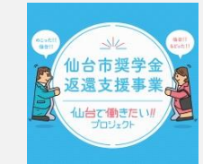
奨学金返還支援事業