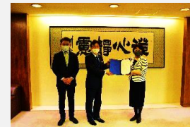
進出企業による立地表明式

仙台蒲生産業団地について、市有地の利活用を希望する事業者の募集や契約に関する手続きを円滑に実施するとともに、当団地全体に産業集積を図るため、企業誘致活動を実施します。また、震災前の水準以上に回復した仙台湾区のコンテナ取扱量のさらなる増加を目指し、官民一体となった枠組みによって各種事業を実施します。