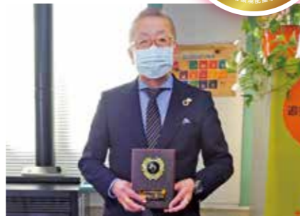
守屋運輸株式会社仙台支店様