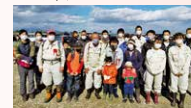
市民植樹への参加したメンバー

東日本大震災により甚大な被害を受けた東部沿岸地域のみどりの再生を図る「ふるさとの杜再生プロジェクト市民植樹」に参加しています。