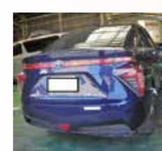
水素自動車の導入