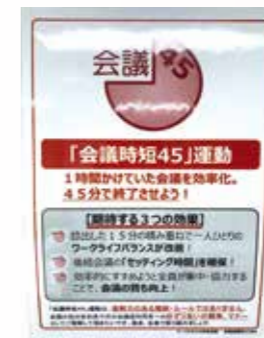
「会議時短45」運動の実施

クールビズ等の実施や、「会議時短45」運動による会議時間の短縮、特別健康日(定時退庁日)の設定により、業務改善に伴う使用電力の節電を行っています。