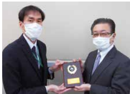
株式会社あるく様