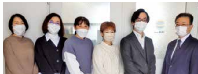
株式会社あるくの社員のみなさま

当社は、「東北のICTのふもとをひろげる」をスローガンとして、全国的にも類のない「再生パソコン」の資材調達から製造、流通・販売までを行っています。「メイドイン東北・宮城」を掲げて、東北地方のICT活用と資源リサイクルを推進しています。