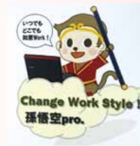
在宅勤務などの推進

在宅勤務などの働き方改革を意味する「Change Work Style!! 孫悟空pro.」を推進しています。出勤率30%を目標とし、リモート会議の普及やごみ箱の分別パトロールなど、廃棄物の抑制に努めています。