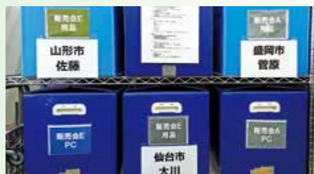
荷物運搬に使用する通い箱

東北各地で現地販売員を採用しており、販売会開催時に自動車による移動距離を抑えています。また、本社と現地との通信用封筒や荷物運搬に通い箱を使用しています。