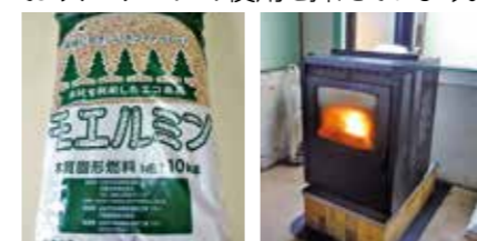
自社製造の木質ペレット ペレットストーブ

宮城県のグリーン製品として認定を受けた木質ペレットを自社で製造しています。社内でもペレットストーブを使用しており、エアコンの使用を抑えています。