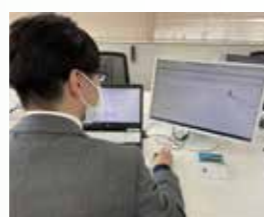
日報などの電子化