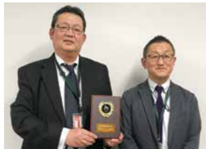
株式会社日立ソリューションズ東日本様