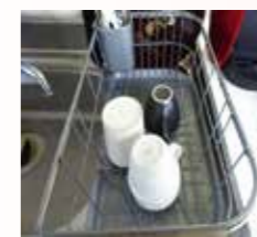
マイカップの利用

新聞紙、紙類、缶、びん、ペットボトルの分別や、マイカップの利用を推進することにより、ごみの排出を抑えてごみ袋の使用枚数を削減しています。水素自動車の導入や、仕分け・出荷には排ガスが出ないバッテリーフォークリフトを使用することで、CO 2 削減に取り組んでいます。