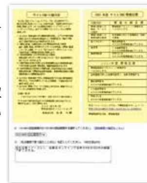
電子版環境カードの利用

電子版「環境カード」へ社員各自が業務で取り組む事を登録したり、環境イベント情報や負荷実績等を周知するメールマガジンを毎月発行するなど、会社全体で環境推進に取り組んでいます。