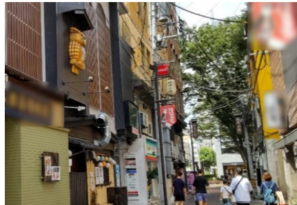
定禅寺通エリア内の雑居ビル