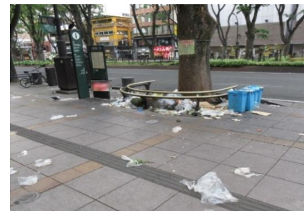
定禅寺通の事業ごみ散乱の様子