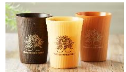
オリジナルタンブラーイメージ