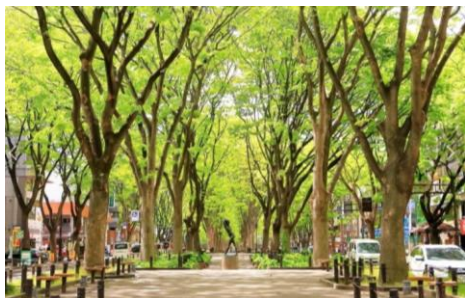
定禅寺通の周辺景観