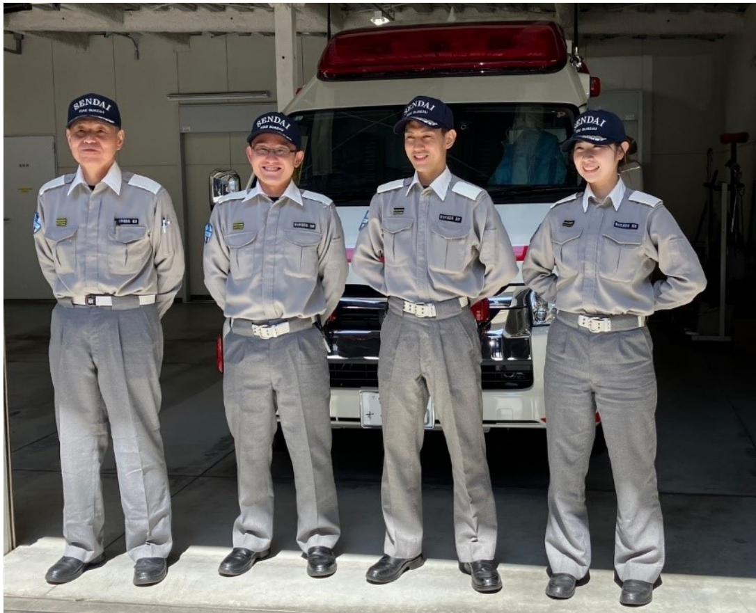
中央デイトタイム救急隊 運用開始