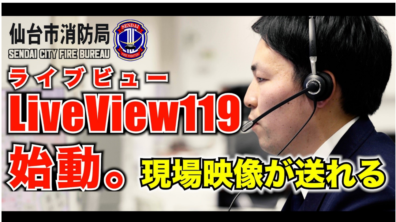
119 番通報映像サポートシステム(LiveView119)