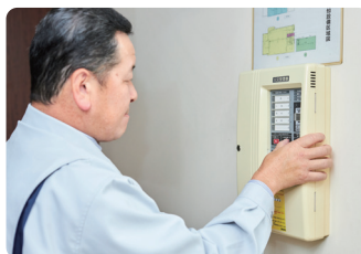
負担軽減で、現場での保守・点検に集中

事務作業の効率化で取引先への対応も早くなり、より最適な防災システムの提案に注力できる時間も生まれます。災害を未然に防ぎ、地域に貢献することが当社の使命。お客様から求められる防災対策に今まで以上に集中できる業務環境づくりを進めていきます。