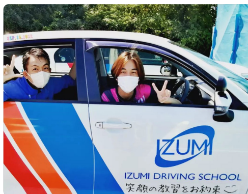
教習生の利便性を第一に考え、高い満足度を実現!

業務を効率化できたことで、インストラクターに加えてフロントスタッフも担当制にすることができました。県内自動車学校で初めてのビジネス用のチャットを導入し、教習生から2人の担当者にいつでも受講予約や心配事の相談がチャットで直接でき、きめ細かな対応が可能となりました。今後もIT化で競争力強化を図るとともに、ドローン教習などの新事業にも取り組む予定です。