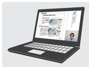
いつでもどこでもオンデマンド受講

送迎バス予約や所在地確認ができるアプリを導入し通学時の利便性を高めました。また学科教習の24時間オンデマンド受講も実現。どちらも県内初です。このような取組により、2021年は年間入校者数が約1,200人と大幅にアップしました。