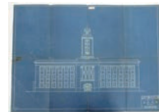
旧市庁舎正面図面