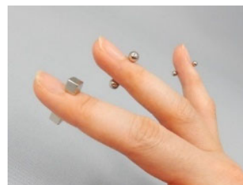
指を挟んでも付く程の強い磁力を持つマグネットボール

マグネットボール、キューブを誤飲すると生死に関わることがあります。少しでも誤飲が疑われる場合には、すぐに医療機関を受診してください。