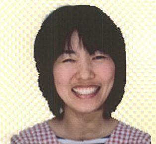
家庭的保育者 (保育ママ)