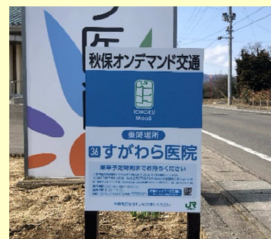
↑この看板が乗降ポイントの目印です