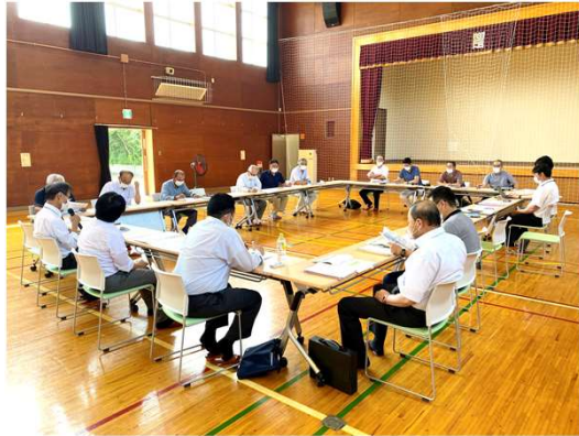
18名が出席した代表者会議の様子 (7月21日 秋保市民センター)

今回は、チラシやポスター等の広報紙や、住民説明会の内容などについて話し合います。 (※次号の考える会通信では、試験運行の運行内容を紹介します。)