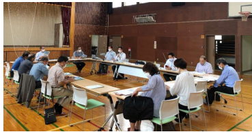
↑14名が出席した代表者会議 (8月18日 秋保市民センター)

◆秋保町内のごからも乗降できるように なります このたび、10月1日から実施する、ぐるりんあきうの運行計画を策定しました。 今回の試験運行では、秋保町内どこからでも乗車可能に、1時間前までの予約で利用が可能、また、小学生以下の利用料金は一律100円にするなど、利用者の皆さまにとって、より利用しやすい計画となるよう改善しています。 今後、国からの許可を得られれば、10月1日(金)より試験運行を開始します。 運行計画概要は、見開きに掲載していますので、ご覧ください。