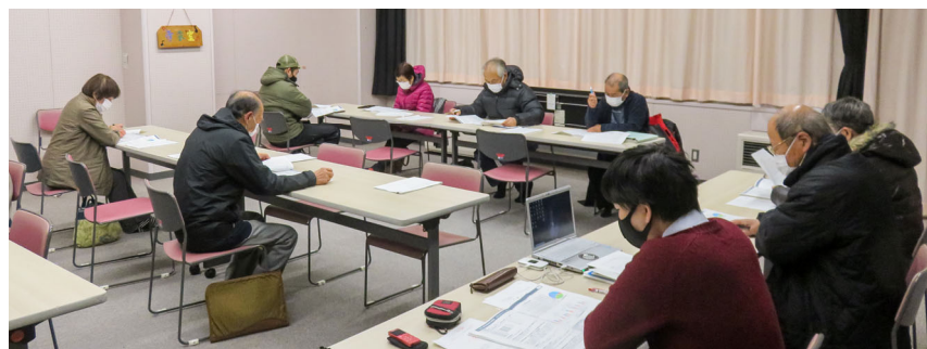
検討委員会9名が参加