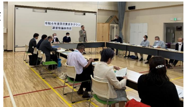
令和6年度総会の様子 ▶

また、6月10日には令和6年度総会を開催し、令和5年度事業の決算及び監査報告、令和6年度の事業計画などを承認しました。