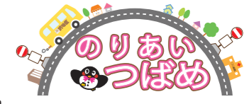
▲車両マグネットイメージ