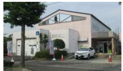
燕沢コミュニティ・センター停留所

また、4月からの運行についての説明会を、各町内会集会所にて3月に開催します。各地区の日時と会場は、別紙にてご案内します。高齢者等運賃や、追加する停留所等について説明する予定です。皆様の参加をお待ちしています。