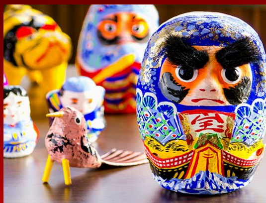
仙台張子(宮城県伝統的工芸品)