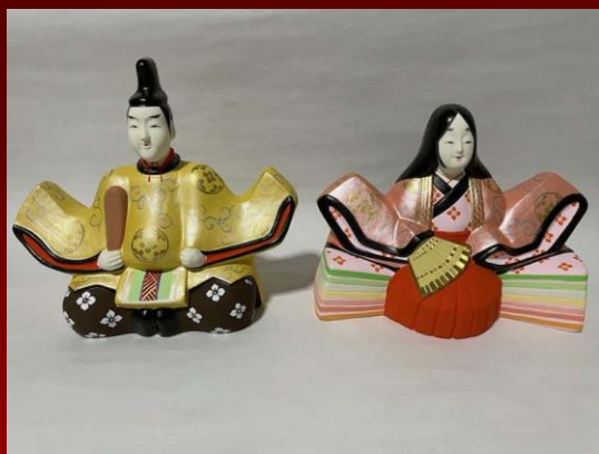
堤人形(宮城県伝統的工芸品)