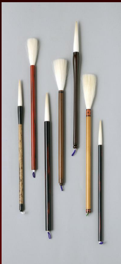
仙台御筆(宮城県伝統的工芸品)