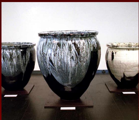
堤焼(宮城県伝統的工芸品)