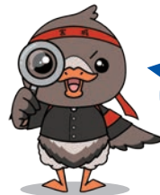
みやぎハローワークキャラクター：ガンちょーさん