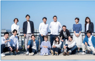
【 ONE TOHOKU HUB 】 しゃべって、すくって、掘り起こす Sendai Shovel

職場、学校、世代、国籍などの垣根を超えて、社会人や学生が交流するイベント。多様な人が集まる仙台のまちで、もっと楽しく働き、学び、暮らすために、仲間をつくり、おしゃべりしませんか。日ごとに対象やトークテーマが異なります。Webページから事前予約がおすすめ。