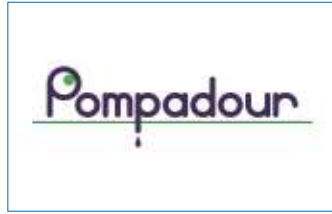
【 Pompadour 】 ランウェイを歩いて本当の自分を実現 RUN your own WAY

職場、学校、世代、国籍などの垣根を超えて、社会人や学生が交流するイベント。多様な人が集まる仙台のまちで、もっと楽しく働き、学び、暮らすために、仲間をつくり、おしゃべりしませんか。日ごとに対象やトークテーマが異なります。Webページから事前予約がおすすめ。