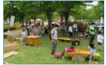
【 仙台市子供未来局 】 多世代で楽しめる「遊び場」を みんなでつくろう

「ポッチャフェス in 仙台」では、昨年東京パラリンピックで話題になった「ポッチャ」を体験できます。ルールも簡単で、障がいの有無や性別、年齢等にかかわらず誰でも楽しめるユニバーサルスポーツ・ポッチャを仙台駅前の開放感あふれる空間で一緒に楽しみましょう!