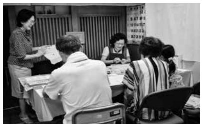
和気あいあいとした雰囲気の中で行われたランチョンマットづくり

セカンドハンドは、高松市を拠点に、主にカンボジア支援のチャリティショップを営む団体です。東日本大震災後の、石巻市への物資支援がきっかけで、仙台市にもショップを開きました。被災された方々の憩いの場になりたいとの思いで運営に当たっています。店内では全国から寄付された物品を販売し、売り上げを被災地支援に充てています。