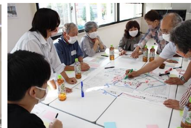
左:ウォーキングマップ 中:セミナーの様子 右:ワークショップの様子