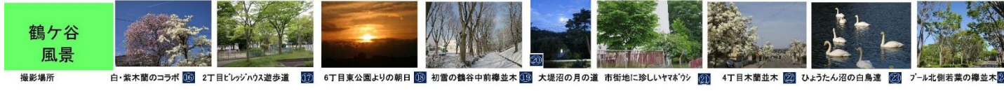
撮影場所 白・紫木蘭のコラボ 16 2丁目レジャースペース 17 6丁目東公園よりの朝日 18 初雪の鶴ヶ谷中前橋木 19 大堤沼の月道 市街地に珍しいヤマボウシ 20 4丁目木蘭並木 21 ひょうたん沼の白鳥達 22 丸北側若葉の桜並木 23