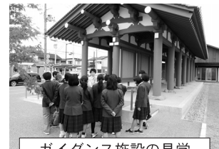
ガイダンス施設の見学

身近な地域の遺跡から出土した土器や埴輪などの貸出を実施しているほか、希望する学校には、近隣の遺跡から出土した土器等の展示コーナーを校内に設営している。