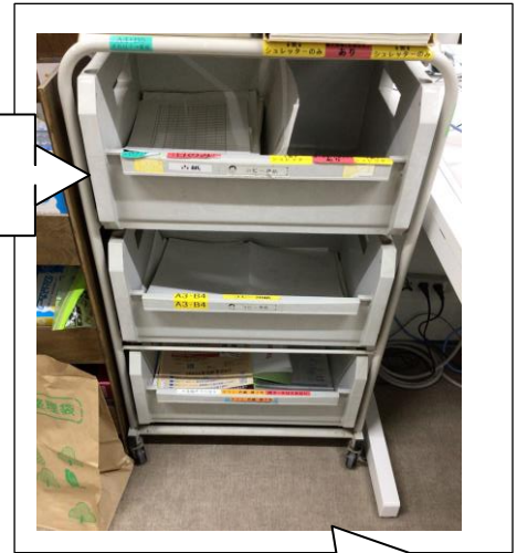
職員室前の古紙回収棚