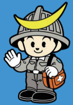
QQまさむね君 (伊達家伯記念會協力)