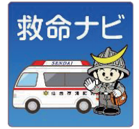
救命ナビ専用アイコン