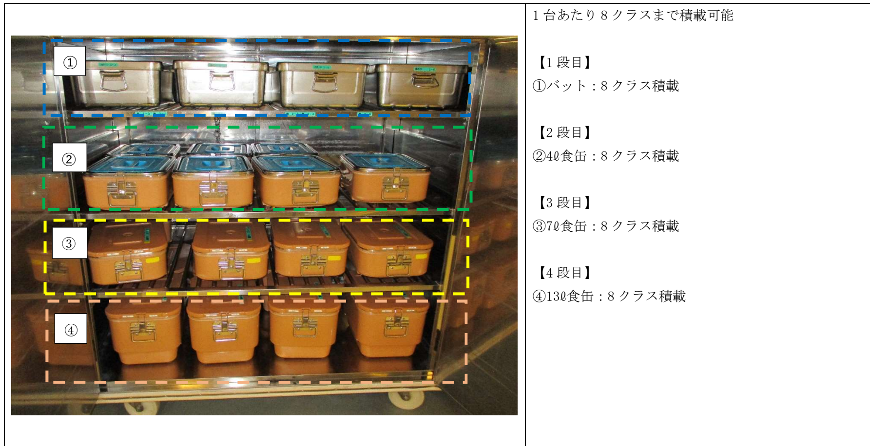
食缶コンテナ (通常提供時の例)