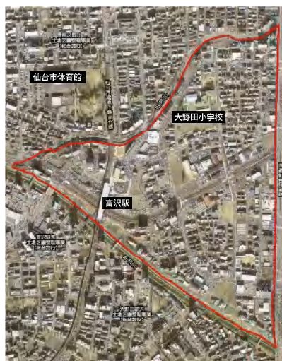
整理後の状況(平成28年1月)