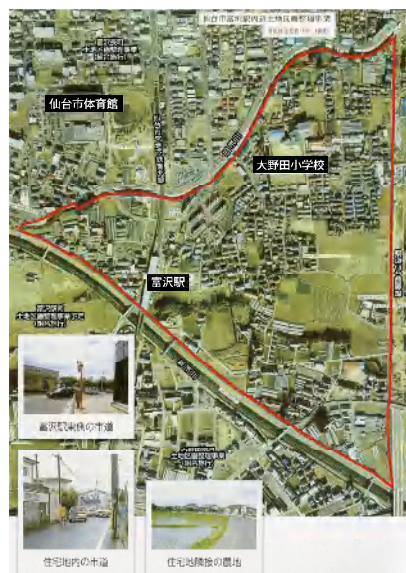
整理前の状況(平成6年1月)