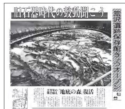
平成8年 1996.11 地底の森ミュージアム開館