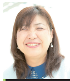
ファシリテーター 特定非営利活動法人 日本ファシリテーション協会 理事