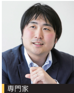
専門家 東北大学災害科学国際研究所 助教

荒井駅にある「せんだい3.11メモリアル交流館」と4月に公開を開始した「震災遺構仙台市立荒浜小学校」。2つの震災メモリアル施設を活用した震災の記憶と経験の継承について話します。