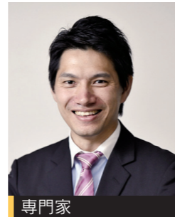
専門家 株式会社VISIT東北 代表取締役

2020東京オリンピック・パラリンピックでは、仙台市はイタリアのホストタウンに登録され、各種競技の事前キャンプ誘致を目指しています。大会に向けた交流促進、交流人口の拡大に向けたおもてなしの取り組みについて話します。