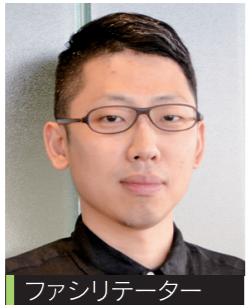
ファシリテーター 公益財団法人 仙台市市民文化事業団