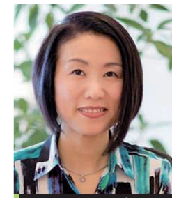
ファシリテーター アナウンサー・朗読家