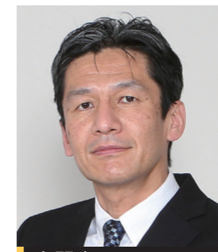
専門家 東北大学大学院工学研究科 教授

老朽化した仙台市役所本庁舎を建て替える準備を始めています。防災拠点としての機能や市民の交流機能など、新しい本庁舎に期待する機能や役割について話します。