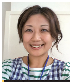
専門家 特定非営利活動法人 ワーカーズコープ 東宮城野マイスクール児童館 館長

仕事等で親が日中家を不在にすることが増えており、子どもの居場所を確保する必要があります。児童クラブや放課後子ども教室に加えて、こども食堂などの新たな取り組みも含んだ、子どもの居場所づくりについて話します。