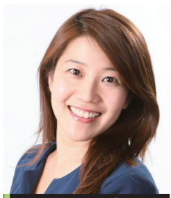
ファシリテーター アリティィーヴイ株式会社 副社長 アナウンサー