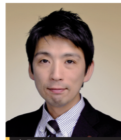
専門家 社会福祉法人 東北福祉会 認知症介護研究・研修仙台センター 主任研修研究員

高齢化の進展に伴い、認知症の人の数は増加が見込まれ、地域で認知症の人と家族を支える体制の整備を進める必要があります。認知症に関する知識の普及啓発や認知症の人と家族の支援など、認知症の人と家族が暮らしやすい地域づくりについて話します。