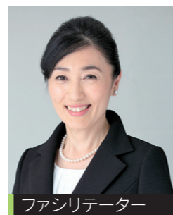
ファシリテーター 第一印象研究所 代表 接客マナー&アンカーマネジメント コンサルタント