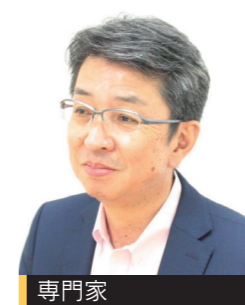
専門家 仙台市中心部商店街活性化協議会 事務局長

仙台駅前には大型商業施設等ができ、にぎわいが増えています。このにぎわいを中心部全体に広げていくために、仙台前から商店街に人々を誘導していく方法や、イベントも含めた、より魅力的な商店街をつくる取り組みについて話します。