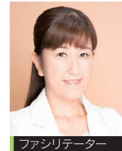
ファシリテーター フリーアナウンサー