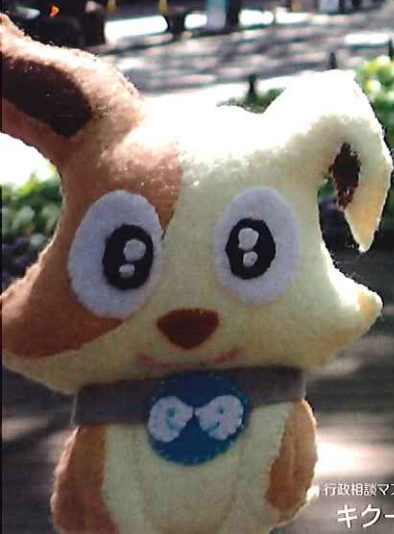
行政相談マスコット キクーン