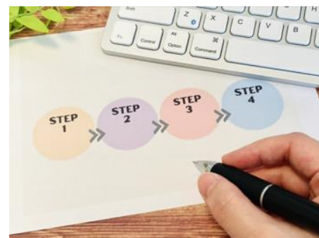
※写真はすべてイメージです。

専門家の協力を得ながら、観光客の安全安心な旅行を推進するためのマニュアルを整備し、 本市の観光レジリエンス強化に向けた取組 を行う。