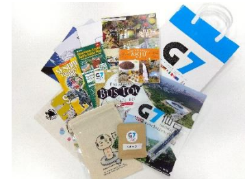
※写真はすべてイメージです。

会合参加者向けに 仙台・東北のPRパンフレットやグッズ を同封したコングレスバッグを配布する。また、 ポスター掲出 により、会議を広く周知する。