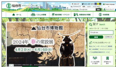
仙台市文化観光局