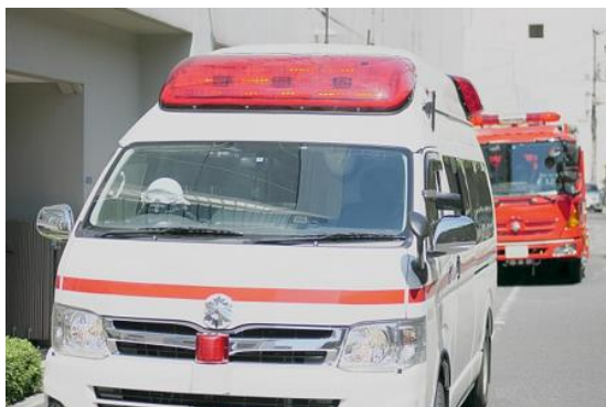
仙台市文化観光局

関係部署との連携を通じ、 危機管理体制や救急医療の確保、衛生対策 等を行い、安全で快適な受入環境を整える。