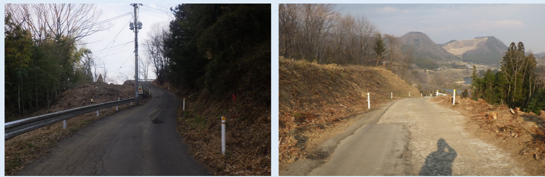
進捗写真 【伐採工完了】

地域の皆様には、日頃より公共事業にご協力とご理解いただき、心より感謝申し上げます。 《工事概要》 本工事は、国道286号バイパス（南赤石工区）整備事業の一環として、(市)湯元上原線において道路拡幅改良工事を施行するものです。 《進捗状況》 今年1月から伐採工を行っており、3月に完了しました。4月中旬より掘削工に着手し残土の搬出を開始する予定です。