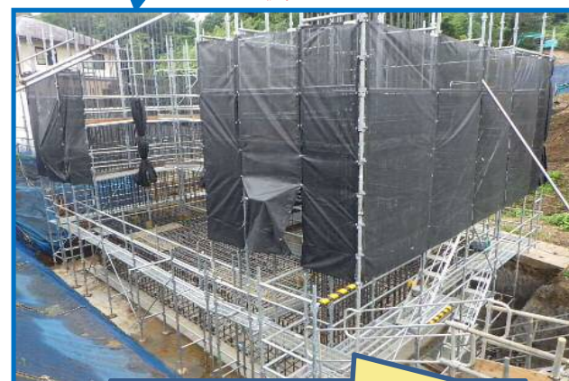
足場を設置し、橋台の鉄筋を組み立てています。