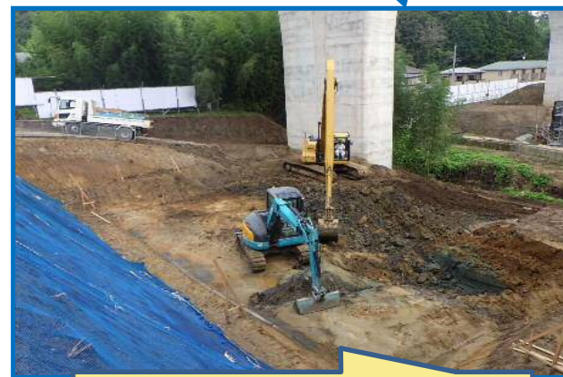
ショベルカーで岩盤を掘削しています。