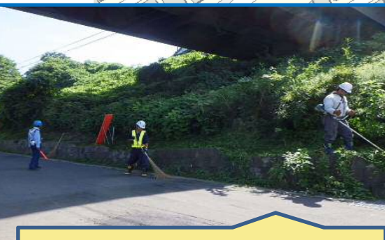
周辺道路の除草・清掃を行っています。