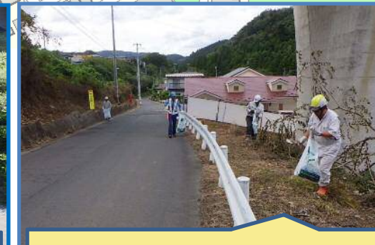
周辺道路のゴミ拾いをしています。