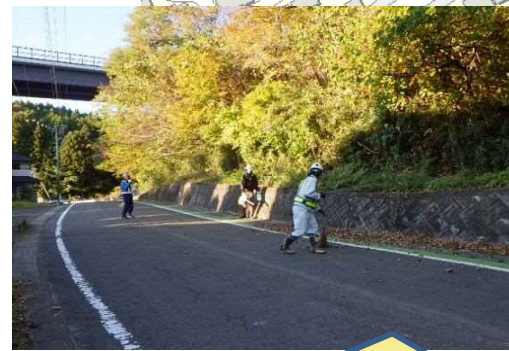
周辺道路の落葉の清掃を行っています。