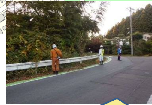
歩行者の安全確保のため除草を行っています。