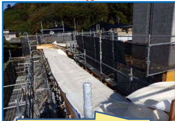
コンクリート打設後の養生中です。