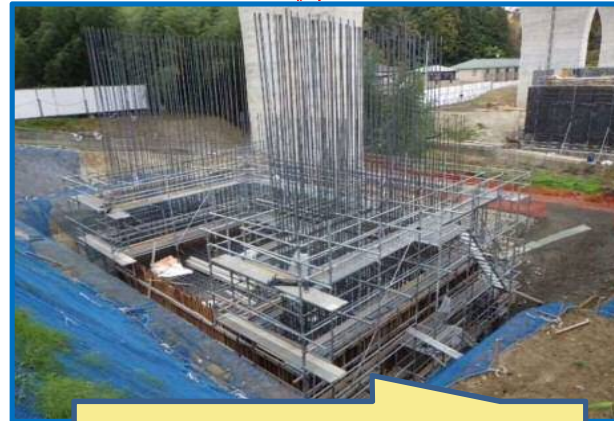
足場を設置し、橋台の型枠を組み立てています。