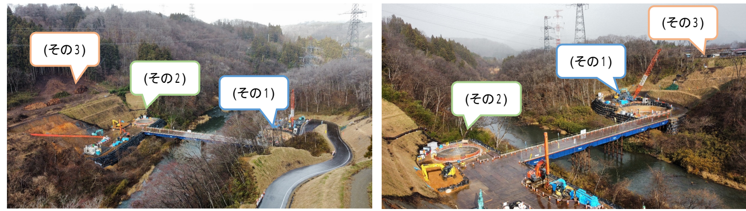
写真: 令和5年12月18日 撮影

橋脚基礎の工事は、ブレーカー及び発破による岩盤破碎により掘削しています。工事期間中、騒音・振動・安全等には十分留意し施工して参りますので、ご理解・ご協力をお願い申し上げます。